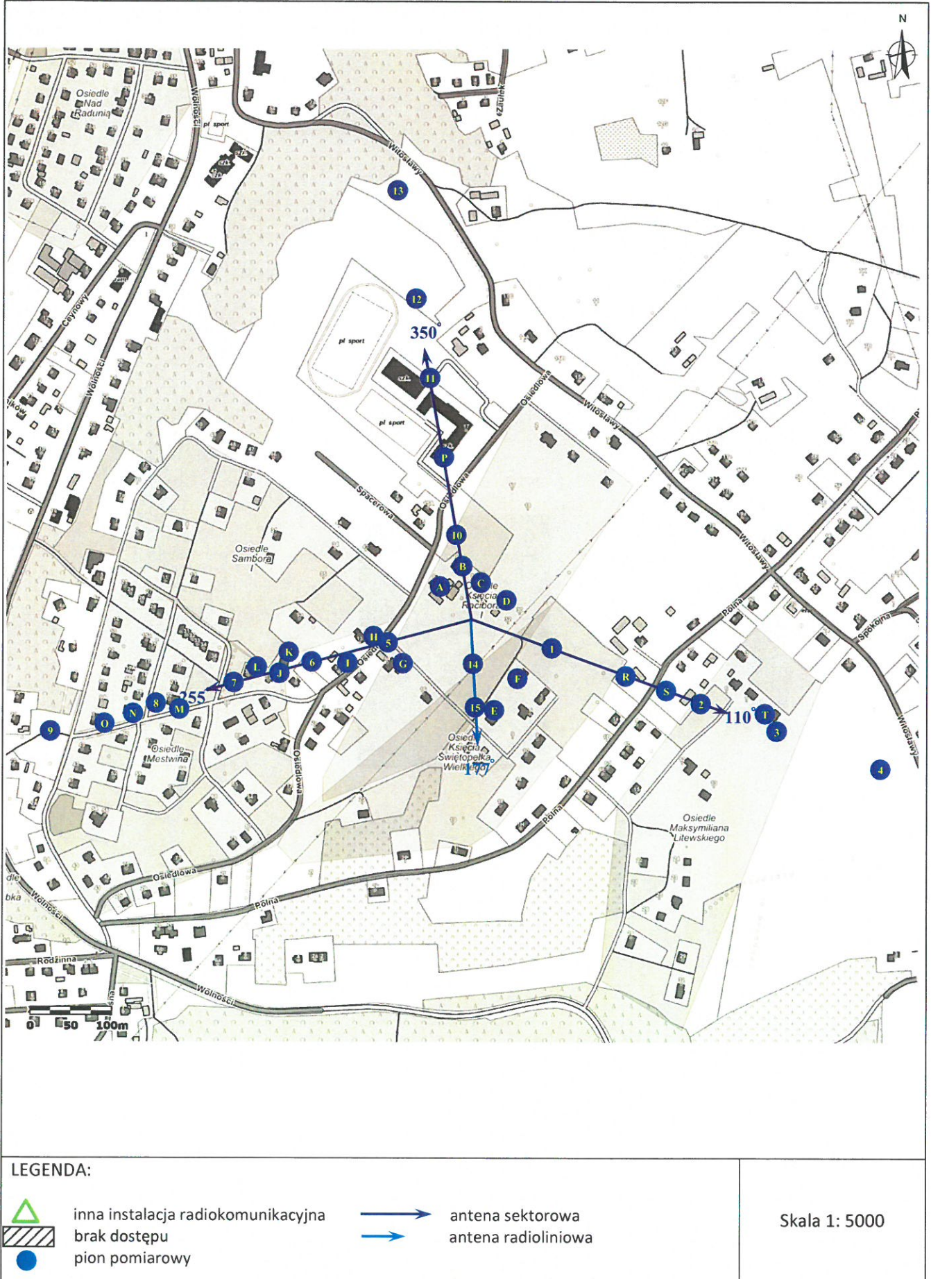
Załącznik 2. Widok pionów pomiarowych