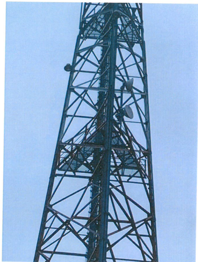
Tabela nr 8