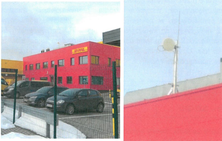
Tabela nr 8

Widok obiektu wraz z zainstalowanym zespołem antenowym